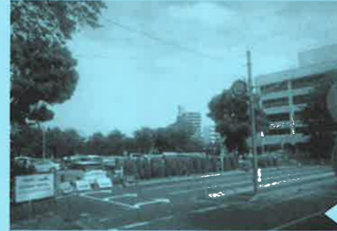
あさのめの強い要望が実り、埼玉県全域をカバーする防災センターが建設される。写真は予定地。（浦和区の県庁駐車場）